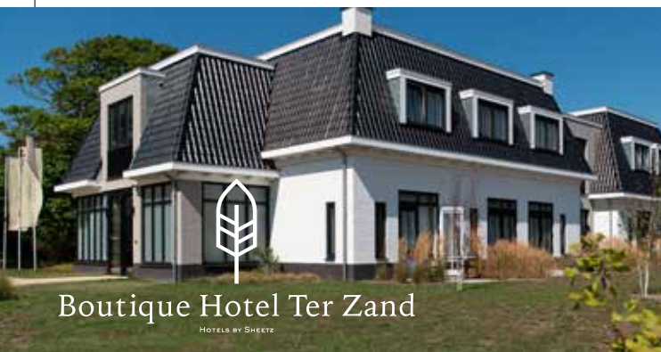
Boutique Hotel Ter Zand

Op een unieke locatie in Zeeland, dicht bij natuurgebied De Zeepe Duinen en het strand van Westerschouwen, vind je sinds circa anderhalf jaar het luxe Boutique Hotel Ter Zand . Perfect om heerlijk te genieten van alles wat de veelzijdige Zeeuwse kust te bieden heeft.